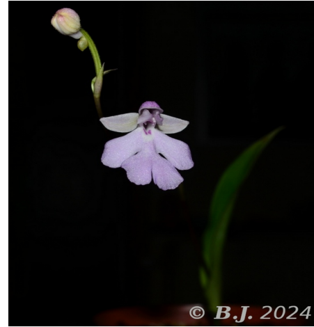
Cynorkis boinana (Madag.)