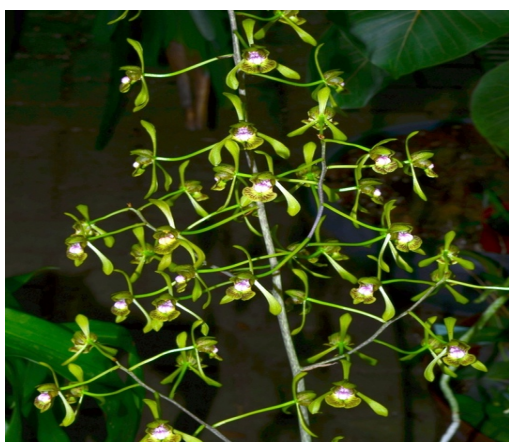
Oeceoclades calcarata (Madag.)

Tetramicra bulbosa Dominik.Rep., 2 Jblühh. Lose F 8,- €