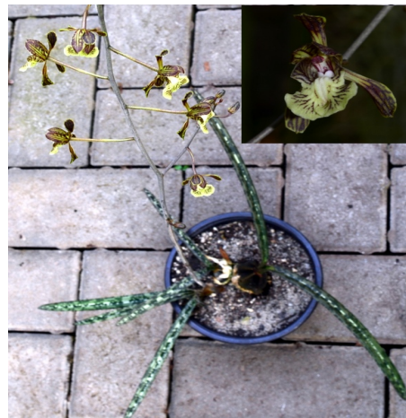
Oeceoclades decaryana (Madagaskar)