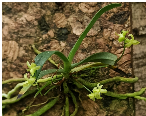
Angcm. sacciferum O-Afrika