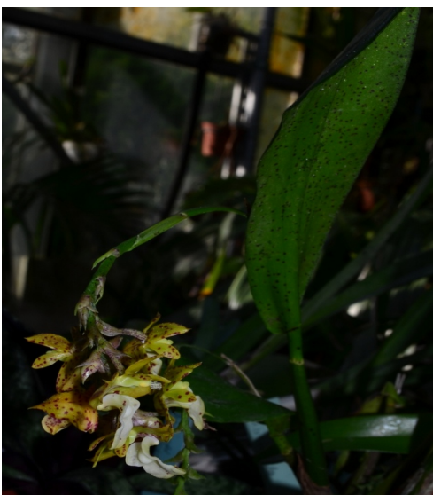
Polystachya maculata Afrika