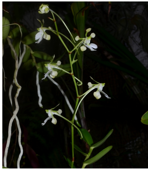
Neobathiea spathulata N-Madag.