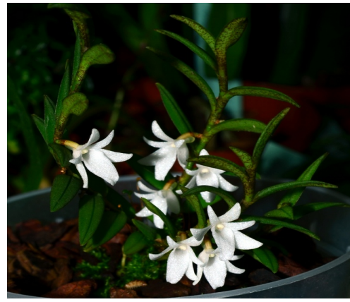
Angraecum pectinatum Madag., Reunion