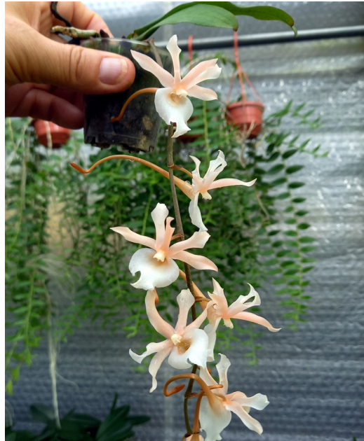
Eurangis E.galeandrae x Args.kotschysana