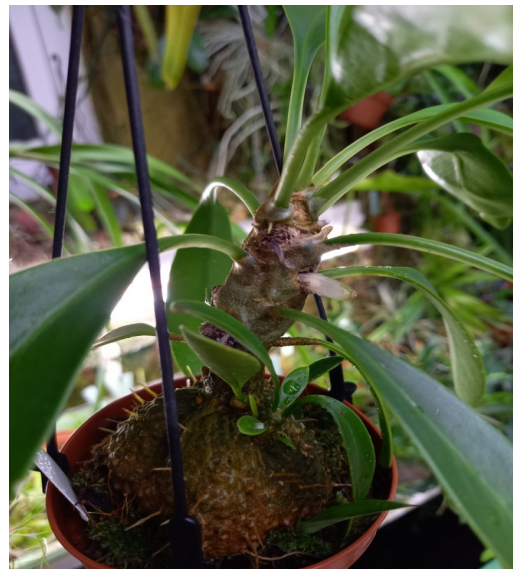
Myrmecodia beccaryi Asien