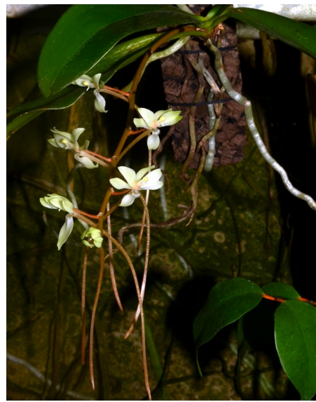
Aerangis ikopana (Madag.)