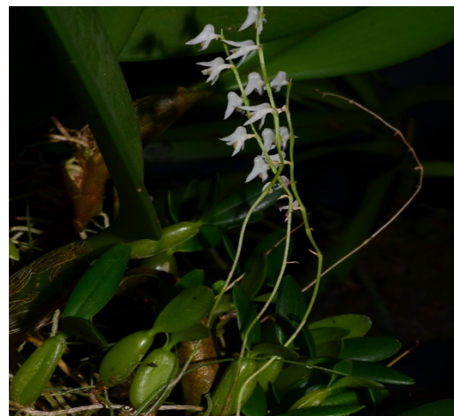
Genyorchis apetala Afrika