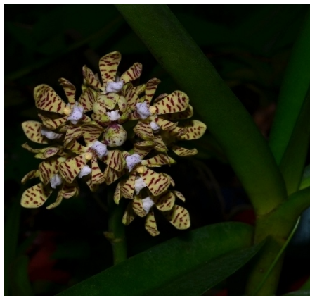
Acampe pachyglossa (Simbabwe)