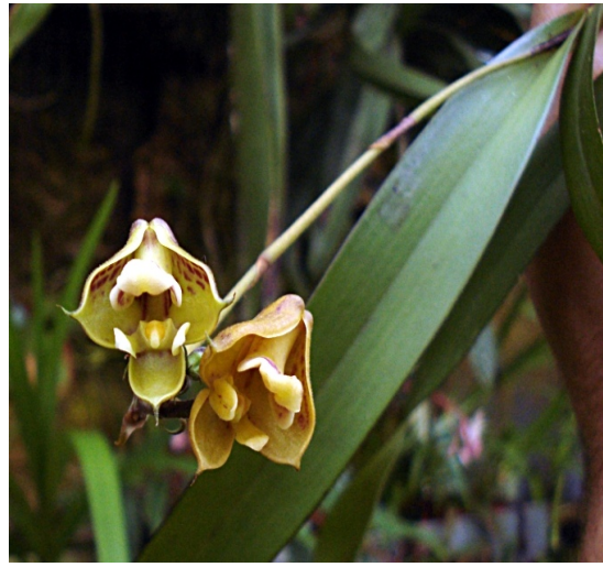
Polyst. galeata var. minor Afrika