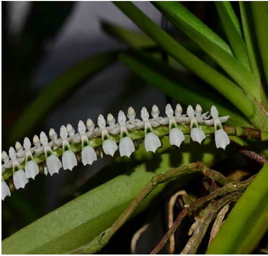
Listrostachys pertusa W-Afrika