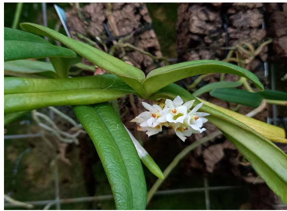
Calypstrochilum christyanum Afrika

Ambrella longituba ☼ Madagaskar, blühfähig lose F 12,- €