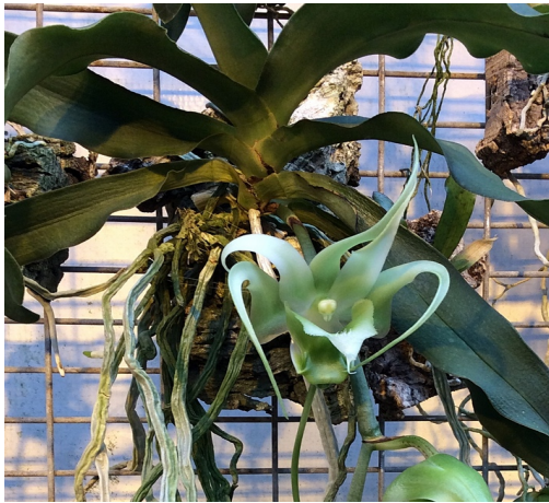
Aeranthes henrici* Madag.