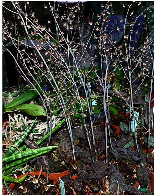
Oeceoclades roseovariegata N-Madag. (Epitheton Oecl. gracillima ist illegitim)