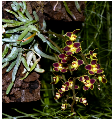
Chilochista lunifera rot