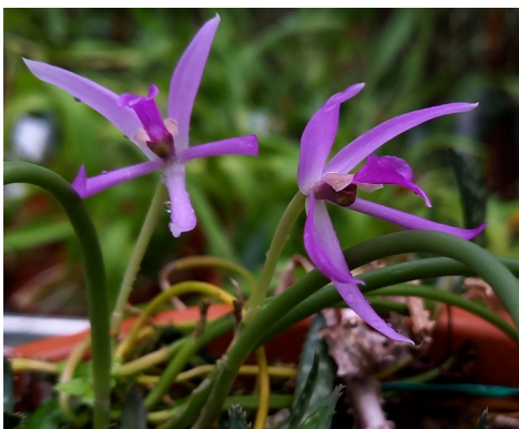
Leptotes pohlitanocoi Brasilien