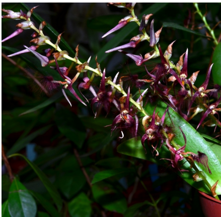
Bulbophyllum barbigerum Afrika