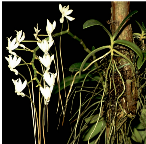
Aerangis ellisii var. ellisii Zentr.-Madag.