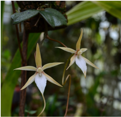
Aerangis monantha Zentr.Madagaskar