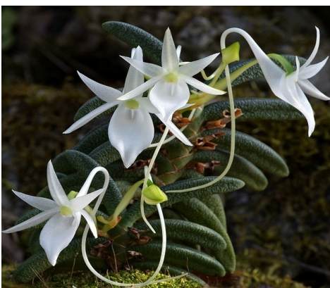
Angraecum aloifolium Madag.