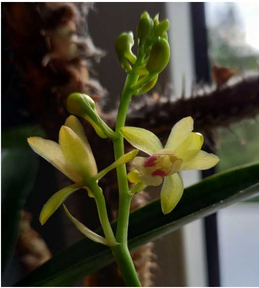
Oeceoclades maculata W-Afrika