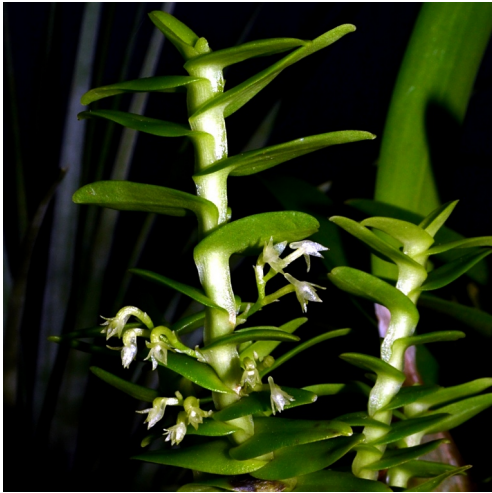
Angraecum alleizettei Madagaskar