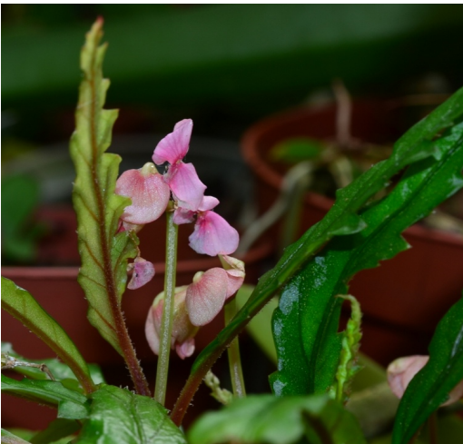
Begonia henri-laportei (Madagaskar)